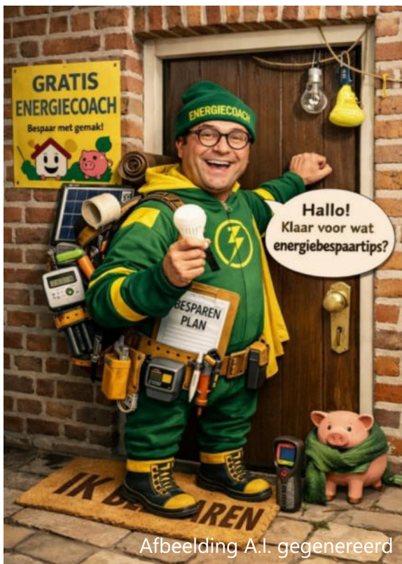
Afbeelding A.I. gegenereerd

Lees meer over de gratis energiecoach op pagina 5