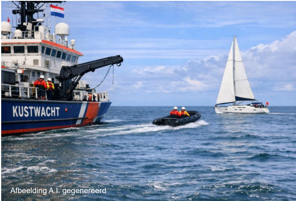
Afbeelding A.I. gegenereerd

De kustwacht controleert intensiever naar aanleiding van recente drugsvondsten langs het strand en de gestegen brandstofprijzen.